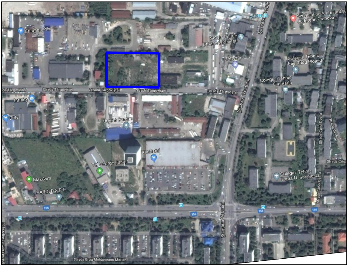
INCADRARE IN ZONA sc 1:2000